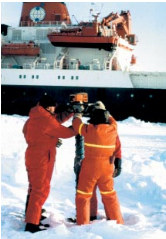
Abbildung 2: Eisbohrungen in der Antarktis. Im Hintergrund das Forschungsschiff Polarstern

chemische Struktur der Verbindungen aufzuklären. Dabei ist die Neugier nicht nur grundsätzlicher Natur: Zahlreiche Stoffe des chemischen Kommunikationssystems von Mikroorganismen können Nahrungskonkurrenten vertreiben oder andere Mikroorganismen sogar abtöten: Wir bezeichnen und nutzen sie dann als Antibiotika, wenn wir auch ihre wahre Bedeutung meist noch nicht kennen.