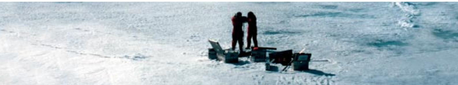
Abbildung 4: Polarforscher bei der Entnahme von Eis-Bohrkernen

■ Drugs from micro-organisms – antibiotics – are an essential part of our modern medicine. The development of resistance, however, is forcing us to search steadily for new micro-organisms with antibiotic properties, even in very exotic habitats. Are these compounds to be found only in tropical rain forests and warm oceans? Scientists at the Institute of Organic and Biomolecular Chemistry of the University of Göttingen have been screening the shelf ice of the Polar regions. One result of their investigations is that the polar ice bacteria found there are for the most part living together in peaceful co-existence. Aggressive toxins or active antibiotics are rare hits in this exciting and challenging search. ■