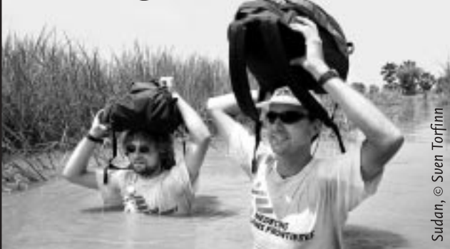
Sudan, © Sven Torfinn

Für Menschen in Not ist uns kein Weg zu weit.