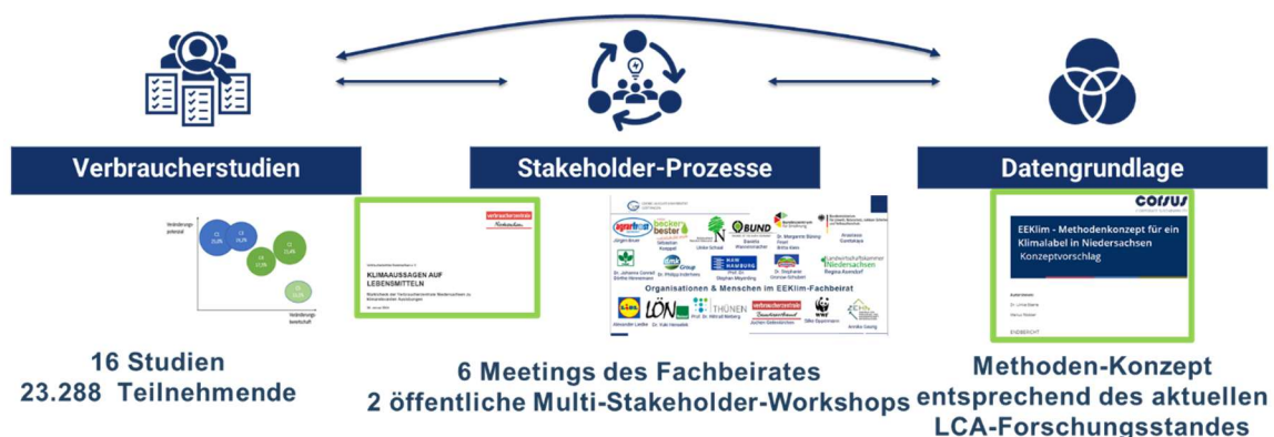
Abbildung 1: Überblick über die Projektbausteine

EEKlim wurde von der Universität Göttingen (Lehrstuhl für Marketing für Lebensmittel und Agrarprodukte sowie Campus-Zentrum für Biodiversität und Nachhaltige Landnutzung) in Kooperation mit der Verbraucherzentrale Niedersachsen e.V., und der Corsus GmbH durchgeführt. Abbildung 1 gibt einen Überblick über zentrale Bausteine des Projekts.